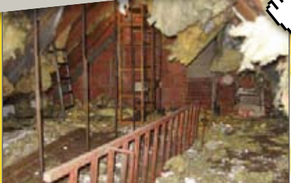
Dachboden nach Waschbär-Besuch

WEITERE INFOS UNTER: www.waschbaerschutz.de