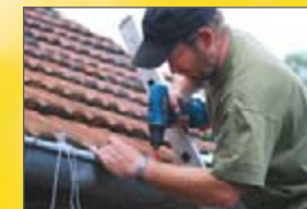
Montage einer Elektro-Zaunanlage