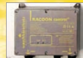
RACOON control® von waschbärschutz