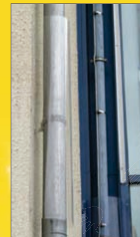
Kletterschutz (patentrechtlich geschützt)