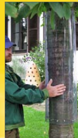
Baumschutz (möglichst unauffällig)