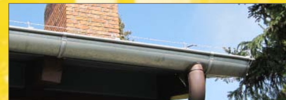
Patentierter Elektro-Zaunanlage (unauffällige Installation)